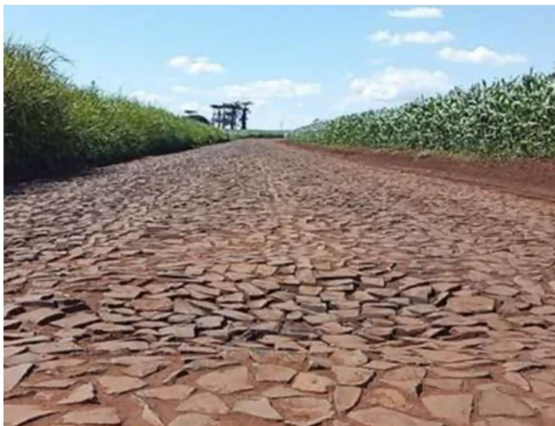
Pavimento poliédrico, executado com solo local