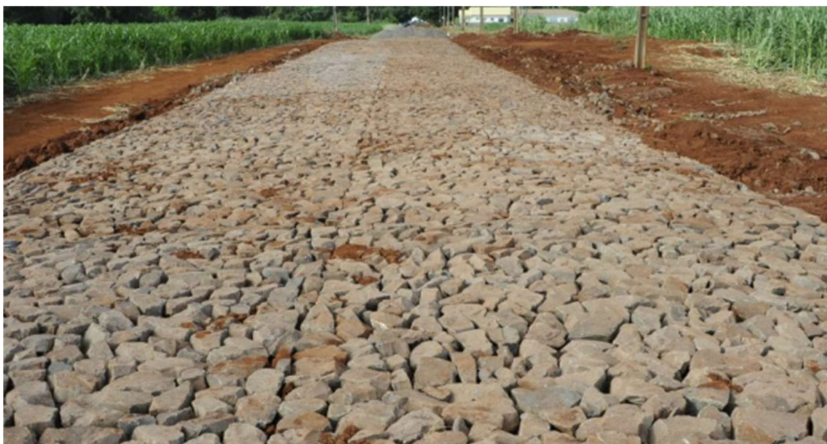
Pavimento poliédrico, etapa que antecede o travamento com solo argiloso